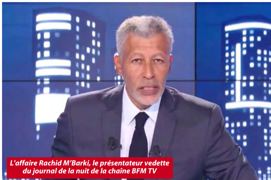
L'affaire Rachid M'Barki, le présentateur vedette du journal de la nuit de la chaîne BFM TV

Les investigations du consortium ont confirmé que M'Barki est bien plus qu'un simple comparse désigné pour les seconds rôles. Pour lui c'est la manipulation à un niveau supérieur. À partir d'une banale information balancée sur son journal, il peut faire beaucoup pour l'image de son pays d'origine, le Maroc et remplir ainsi la mission qui lui est confiée par des agents traiteurs de l'officine sioniste et le Makhzen. Et il n'est pas et ne peut être le seul, dans cette toile d'araignée. La direction de BFM TV lui reproche particulièrement la diffusion d'un sujet relatif à un forum économique entre le Maroc et l'Espagne orga-