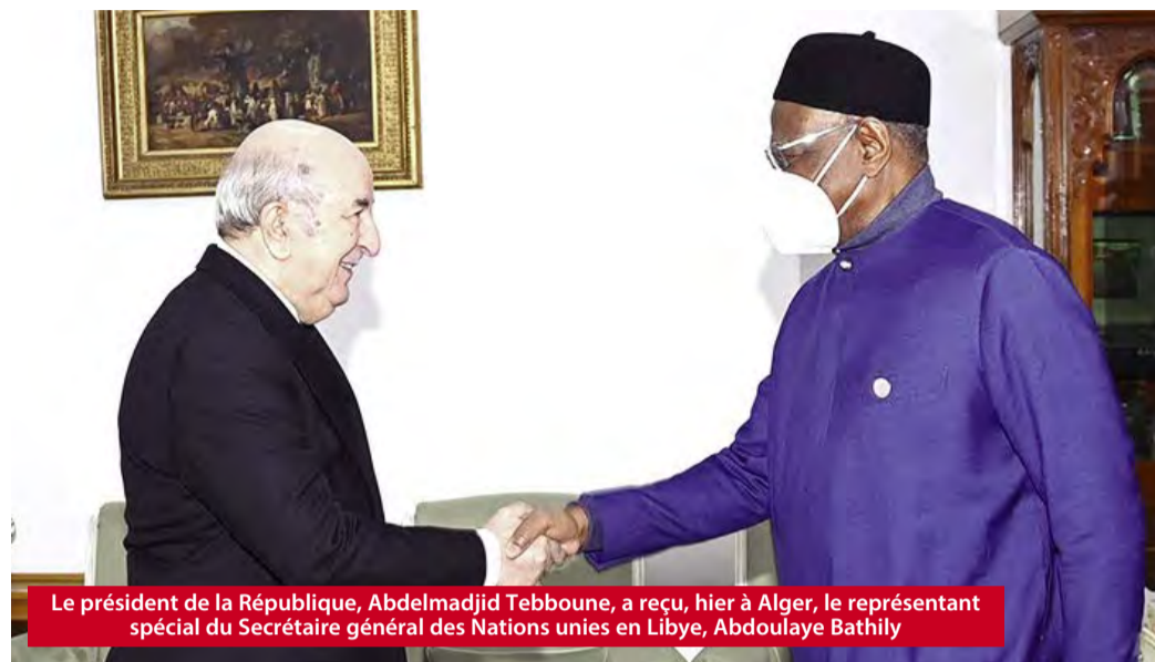
Le président de la République, Abdelmadjid Tebboune, a reçu, hier à Alger, le représentant spécial du Secrétaire général des Nations unies en Libye, Abdoulaye Bathily

Le représentant spécial du secrétaire général de l'ONU pour la Libye et chef de la Mission d'appui des Nations unies en Libye (MANUL), Abdoulaye Bathily, a salué, mardi soir, à Alger, les efforts fournis par l'Algérie afin de retrouver des solutions à la crise libyenne, appelant la communauté internationale à appuyer un processus permettant une stabilisation de la Libye, à travers l'organisation d'élections comme seule solution à la crise.