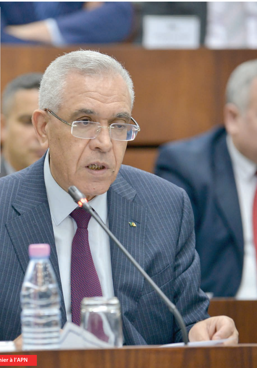
Le ministre de la Justice et garde des Sceaux, Abderrachid Tabi, hier à l'APN