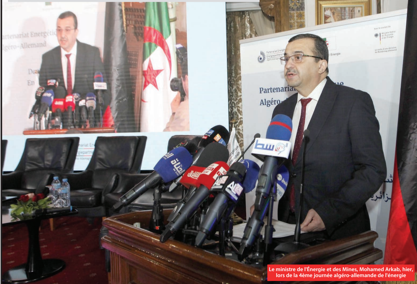
Le ministre de l'Énergie et des Mines, Mohamed Arkab, hier, lors de la 4 ème journée algéro-allemande de l'énergie