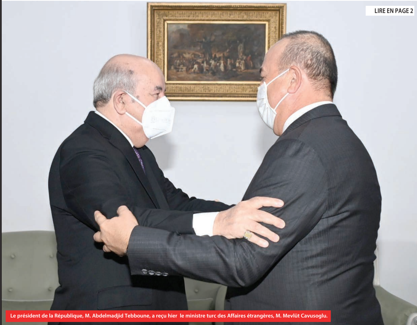
Le président de la République, M. Abdelmadjid Tebboune, a reçu hier le ministre turc des Affaires étrangères, M. Mevlüt Cavusoglu.