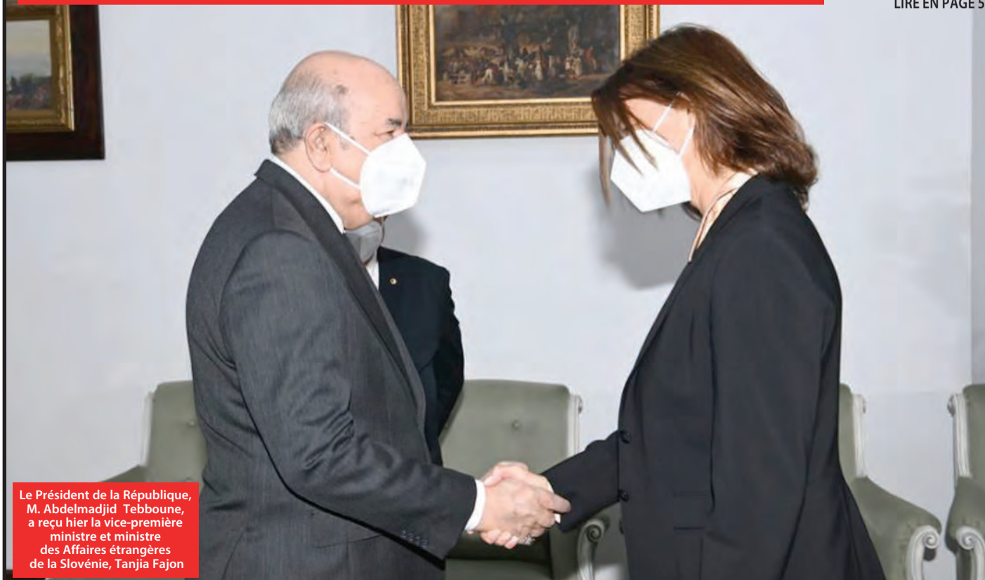
Le Président de la République, M. Abdelmadjid Tebboune, a reçu hier la vice-première ministre et ministre des Affaires étrangères de la Slovénie, Tanja Fajon