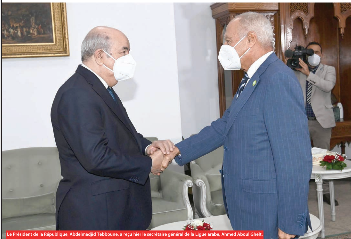
Le Président de la République, Abdelmadjid Tebboune, a reçu hier le secrétaire général de la Ligue arabe, Ahmed Aboul Gheit.