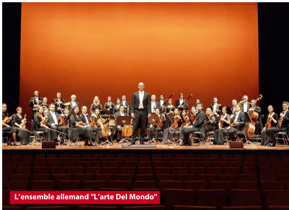
L'ensemble allemand "L'arte Del Mondo"