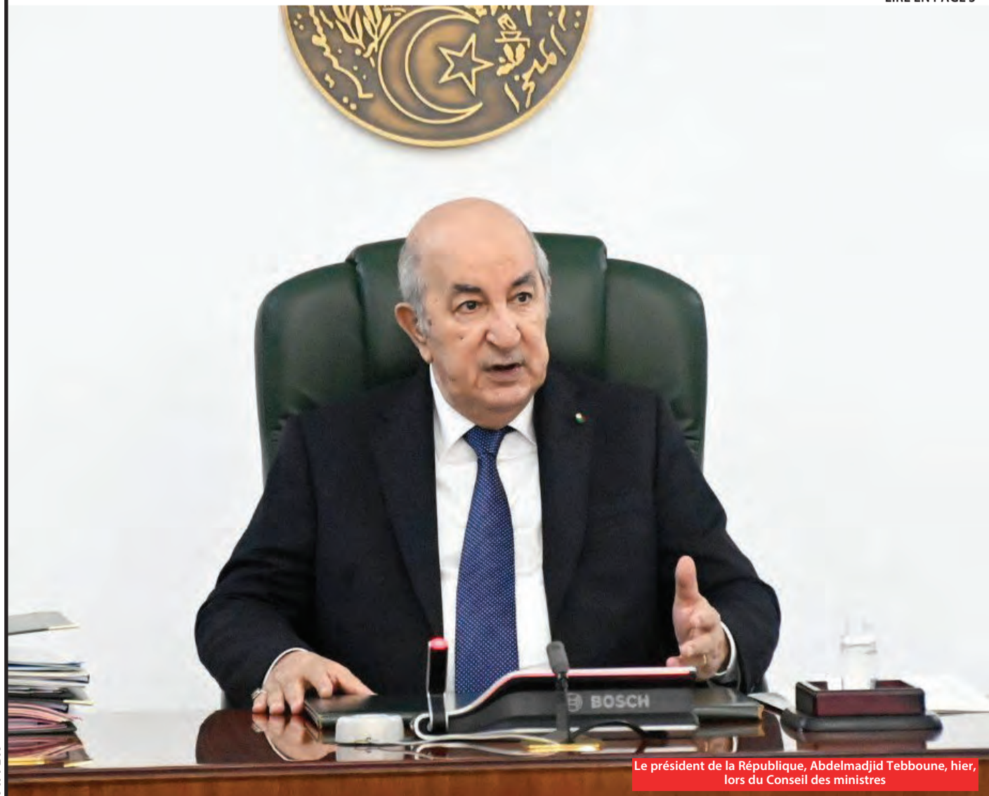
Le président de la République, Abdelmadjid Tebboune, hier, lors du Conseil des ministres