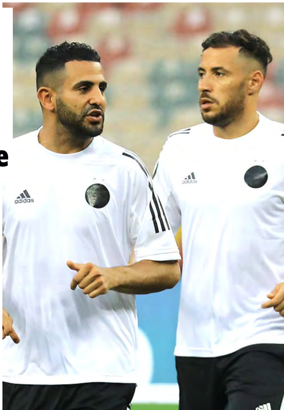
PH. J. DR

Cette baisse de régime met déjà sa place de titulaire en danger. D'ailleurs, le capitaine des Verts n'a été aligné qu'à deux reprises d'entrée depuis le début de la Premier League. Jusque-là, Pep Guar-