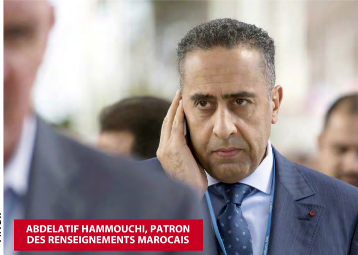
ABDELATIF HAMMOUCHI, PATRON DES RENSEIGNEMENTS MAROCAINS

dernier des Marocains est au courant de cette trahison de ce monarque. M6, n'a fait qu'emboîter le pas à son père et son grand-père et pour ne pas perdre le soutien de ses sujets, il a fait endosser la responsabilité de tout le processus de normalisation et de soumission à Israël au parti-lige, islamiste le PJD, qu'il avait élevé au rang de première formation politique du pays, puis de parti majoritaire et donc aux commandes de l'exécutif, avant de s'en débarrasser aux premières législatives ayant suivi la conclusion des accords de normalisation. La majorité du peuple marocain refuse cette soumission et cette course effrénée vers les bras d'Israël.