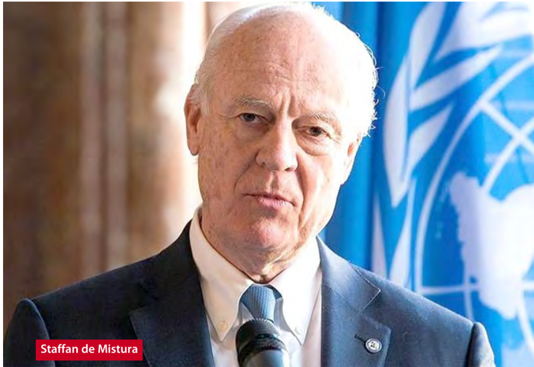
Staffan de Mistura

Attendu hier au Maroc, l'envoyé personnel du SG de l'ONU se rendra également au Sahara occidental pour relancer le processus politique onusien de résolution du conflit entre les deux belligérants. Cette visite, pour tout ce qu'elle constitue comme étape dans la recherche de l'application du droit international, malgré les obstructions du Maroc, soutenu par ses alliés, est un véritable camouflet pour, d'abord, Rabat, et puis, Madrid, qui a cédé au chantage du Makhzen et a trahi la cause sahraouie.