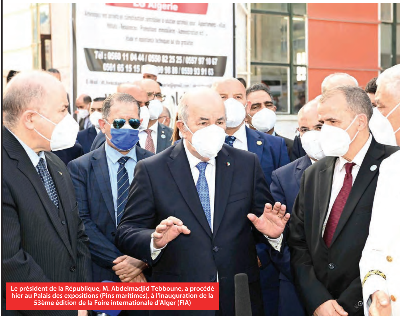
Le président de la République, M. Abdelmadjid Tebboune, a procédé hier au Palais des expositions (Pins maritimes), à l'inauguration de la 53 ème édition de la Foire internationale d'Alger (FIA)