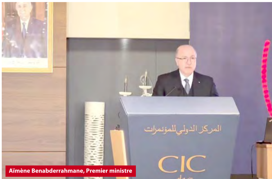
Aïmène Benabderrahmane, Premier ministre

Selon un communiqué des services du Premier ministre, les entretiens ont porté sur la coopération bilatérale aux fins de développer et promouvoir le tourisme en Algérie, conformément aux objectifs tracés dans le Plan d'action du gouvernement en exécution du programme du président de la République. Pololikashvili a passé en revue les différents résultats de la coopération avec l'Algérie et ses perspectives pour la prochaine période et a remis au Premier ministre une série importante de documents d'orientation principalement liés à la stratégie de promotion de la destination « Algérie ». Ces documents d'orientation ont été élaborés en coordination avec le ministère du Tourisme et de l'Artisanat en vue de réaliser un bond qualitatif dans le secteur du tourisme à travers la commercialisation de la destination Algérie et en drainant les investissements touristiques, ajoute la même source. La rencontre a permis aux deux parties d'évoquer les perspectives prometteuses de la coopération bilatérale et de définir une feuille de route commune que les deux parties œuvreront à concrétiser, au cours de la prochaine période, dans plusieurs