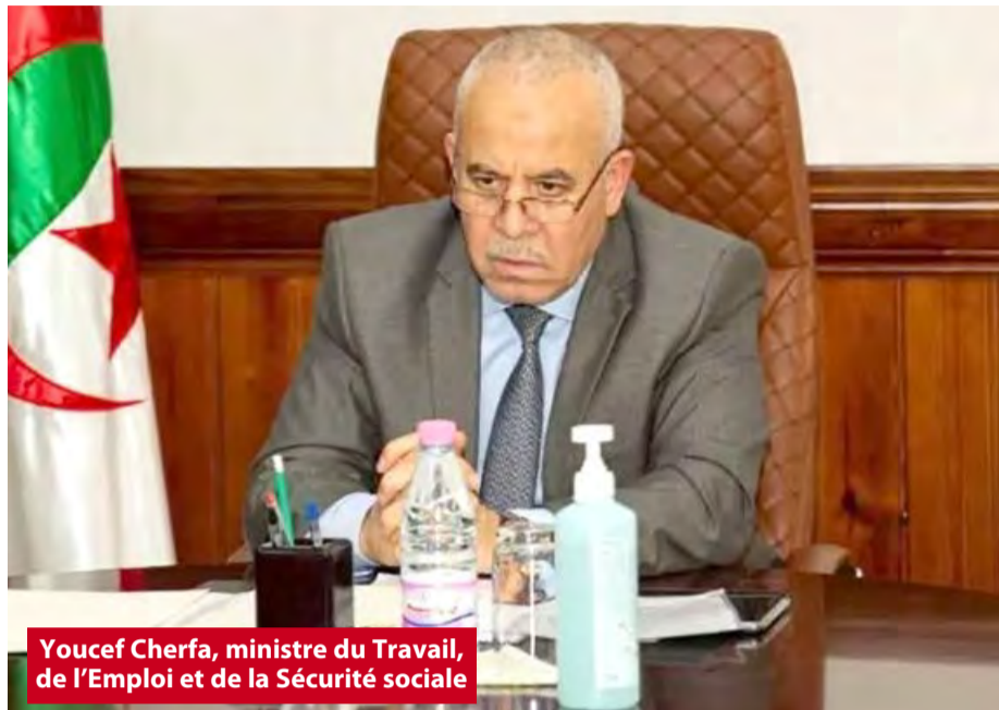
Youcef Cherfa, ministre du Travail, de l'Emploi et de la Sécurité sociale

S'exprimant lors de la présentation de l'avant-projet de loi modifiant et complétant la loi 90-11 du 21 avril 1990 relative aux relations de travail, devant les membres de la Commission de la santé, des affaires sociales, du travail et de la formation professionnelle, à l'APN, le ministre du Travail, de l'Emploi et de la Sécurité sociale, Youcef Cherfa, a fait savoir que les travailleurs du secteur économique relevant du secteur public peuvent désormais procéder à la création de leur entreprise en se conformant pendant à une série de conditions.