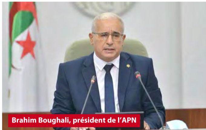
Brahim Boughali, président de l'APN

Parmi les questions débattues lors de cette conférence, l'on cite la situation économique et financière des pays africains, impactée par la pandémie de Covid-19, ainsi que la recherche des voies et mesures nécessaires pour stimuler le processus de relance économique globale et durable pour les pays africains à la suite de la pandémie de Covid-19. Il est également question de la mise en place