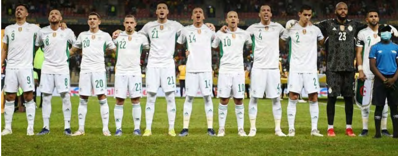
Phs : DR

Au cours de son intervention pour annoncer la poursuite de sa mission aux commandes techniques des Verts, Djamel Belmadi a évoqué les deux premières sorties de l'équipe nationale dans le cadre des éliminatoires de la CAN-2023 en Côte d'Ivoire.