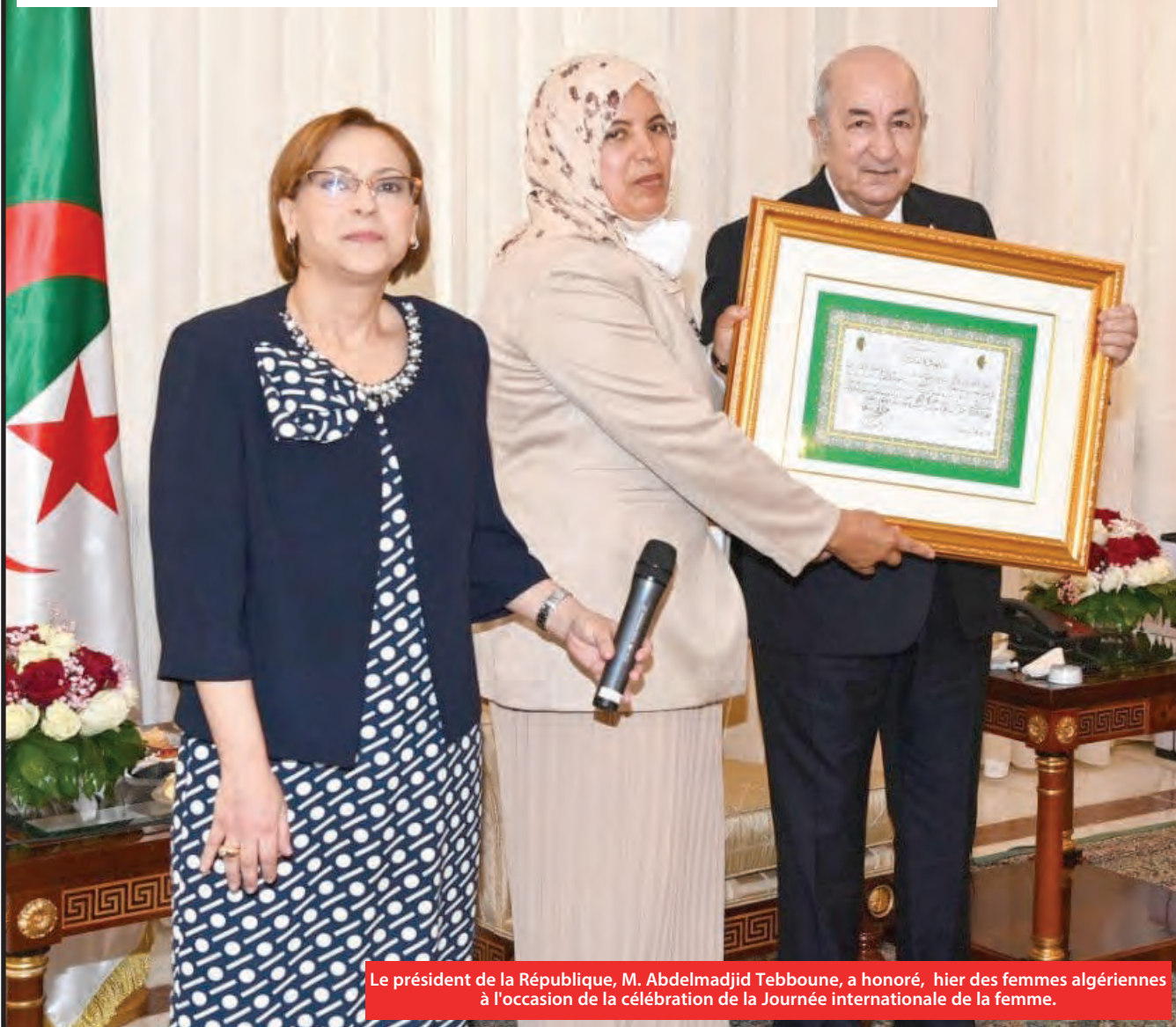
Le président de la République, M. Abdelmadjid Tebboune, a honoré, hier des femmes algériennes à l'occasion de la célébration de la Journée internationale de la femme.