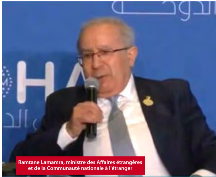
Ramtane Lamamra, ministre des Affaires étrangères et de la Communauté nationale à l'étranger

De Doha, où il a participé aux travaux de la 20 e édition du Forum international sous le thème "La transition vers une nouvelle ère", qui ont commencé samedi, le ministre des Affaires étrangères et de la Communauté nationale à l'étranger, Ramtane Lamamra, a confirmé la disponibilité de l'Algérie à partager son expérience réussie dans la réconciliation nationale, avec la Libye et à accompagner ce pays dans cet important projet, en coopération et en coordination avec le comité de haut niveau de l'Union africaine, chargé de ce dossier.