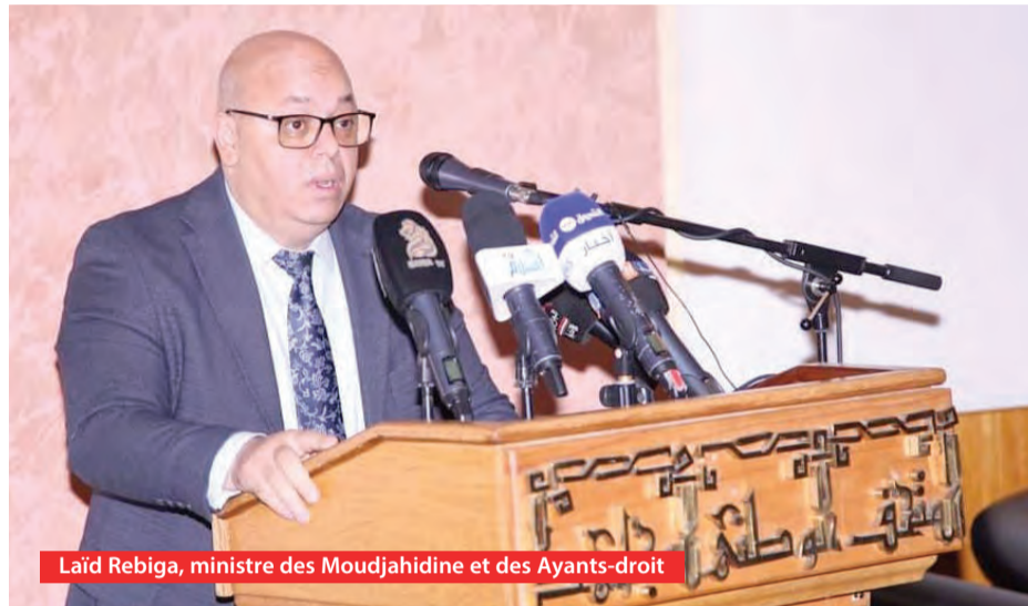
Laïd Rebiga, ministre des Moudjahidine et des Ayants-droit

Le ministre des Moudjahidine et des Ayants-droit, Laïd Rebiga a insisté, hier à Alger, sur la nécessité de poursuivre le travail de "documentation et d'écriture de l'histoire de la Révolution de libération", en vue de la transmettre aux générations montantes.