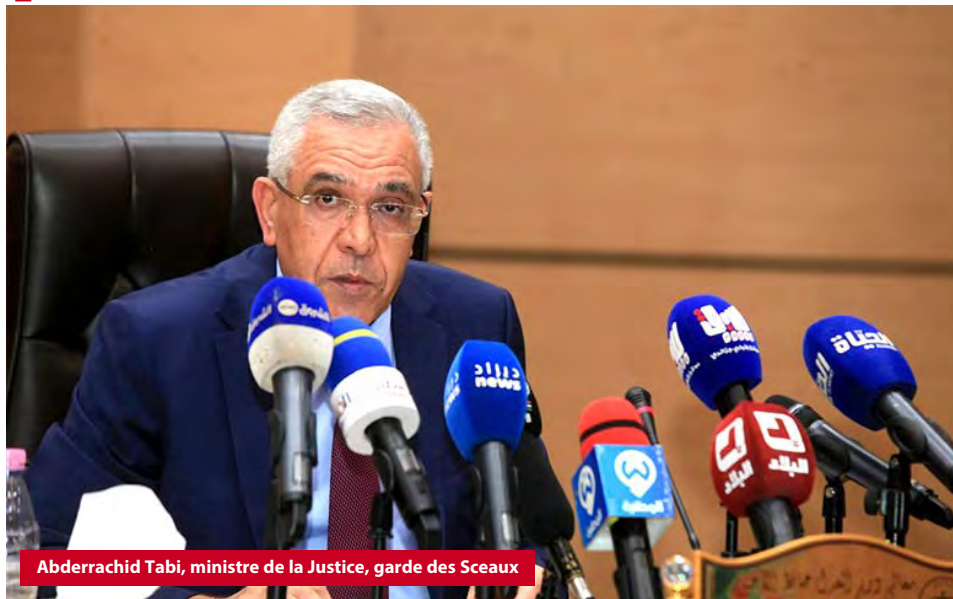
Abderrachid Tabi, ministre de la Justice, garde des Sceaux

Les décrets exécutifs de cette loi devront permettre de réaliser de nouvelles structures », a-t-il dit. « Si cela s'avère impossible pour plusieurs raisons, notamment les affectations financières, l'équipement, les magistrats et les fonctionnaires, nous devons recourir à la justice de proximité comme alternative, où une équipe composée de magistrats spécialisés dans les affaires civiles et d'un procureur de la République spécialisé dans les affaires pénales se déplaceront dans ces régions pour statuer sur les affaires portées de manière périodique selon le besoin en mettant en place des sièges pour la tenue d'audiences », a poursuivi le ministre. Rappelant que « la réalisation de projets dans le secteur judiciaire était soumise à certaines conditions, dont le volume de l'activité judiciaire. Par conséquent, ces régions qui connaissent un nombre faible d'affaires n'ont pas le droit à des structures selon la loi », a-t-il expliqué. « Le secteur de la justice a franchi des étapes importantes, notamment en ce qui concerne les régions connaissant une activité