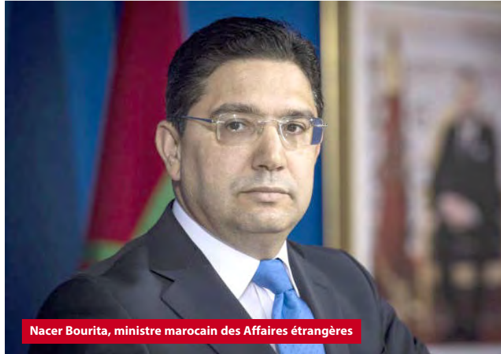
Nacer Bourita, ministre marocain des Affaires étrangères

En déclarant devant De Mistura soutenir la reprise du processus politique sous l'égide de l'ONU en référence au format réductible de « tables rondes », obsolète, insensé et rejeté comme tel, à cause de tout ce qu'il constitue comme fuite en avant face au droit inaliénable des Sahraouis à l'autodétermination, Rabat s'emmêle les pinceaux. Et il se fait vite trahir par ses visées expansionnistes à travers son invraisemblable et honteux « plan d'autonomie » au Sahara occidental.