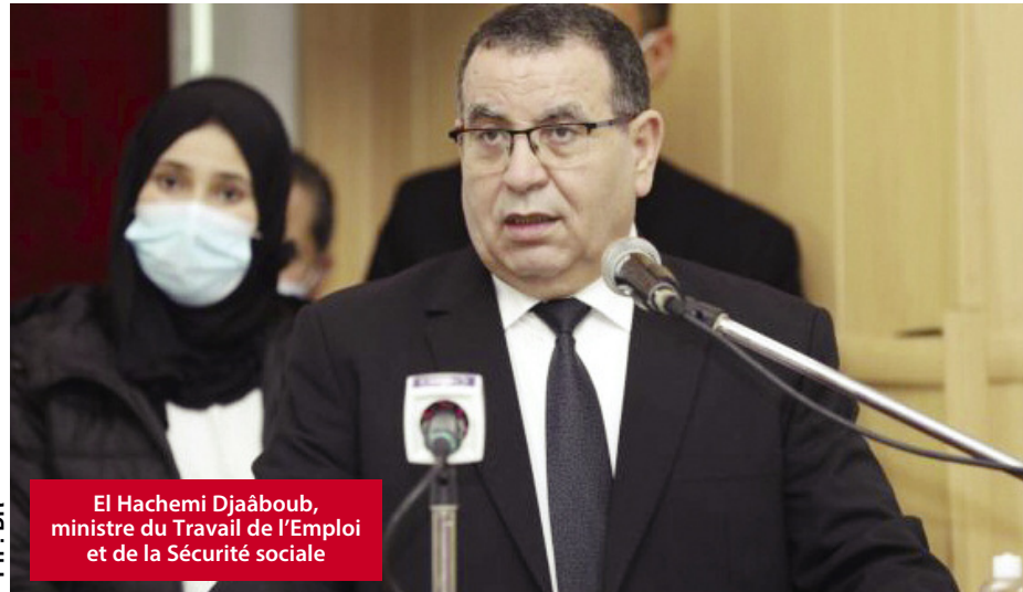
El Hachemi Djaâboub, ministre du Travail de l'Emploi et de la Sécurité sociale

En marge d'une réunion de coordination avec les organisations patronales et les syndicats, organisée pour la préparation de l'Algérie aux travaux de la 109ème édition du Congrès international du Travail, Djaâboub a précisé que l'Algérie n'est pas mentionnée dans cette liste depuis 2017. Ce qui traduit, a-t-il estimé, les avancées considérables réalisées en matière de respect des normes du travail. Djaâboub a ajouté que ces avancées sont sensiblement palpables en ce qui concerne notamment l'application de l'accord international 87 sur les libertés syndicales et la protection du